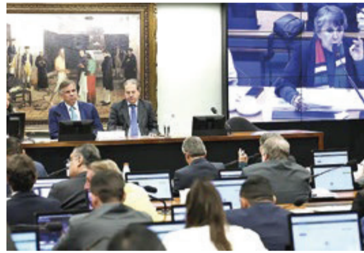
Debate sobre a redução da maioria penal se arrasta há anos no Congresso Nacional e ainda divide opiniões entre parlamentares

Filho (União-PE) argumentou que menores são frequentemente aliciados por facções criminosas devido às regras atuais de responsabilização penal.