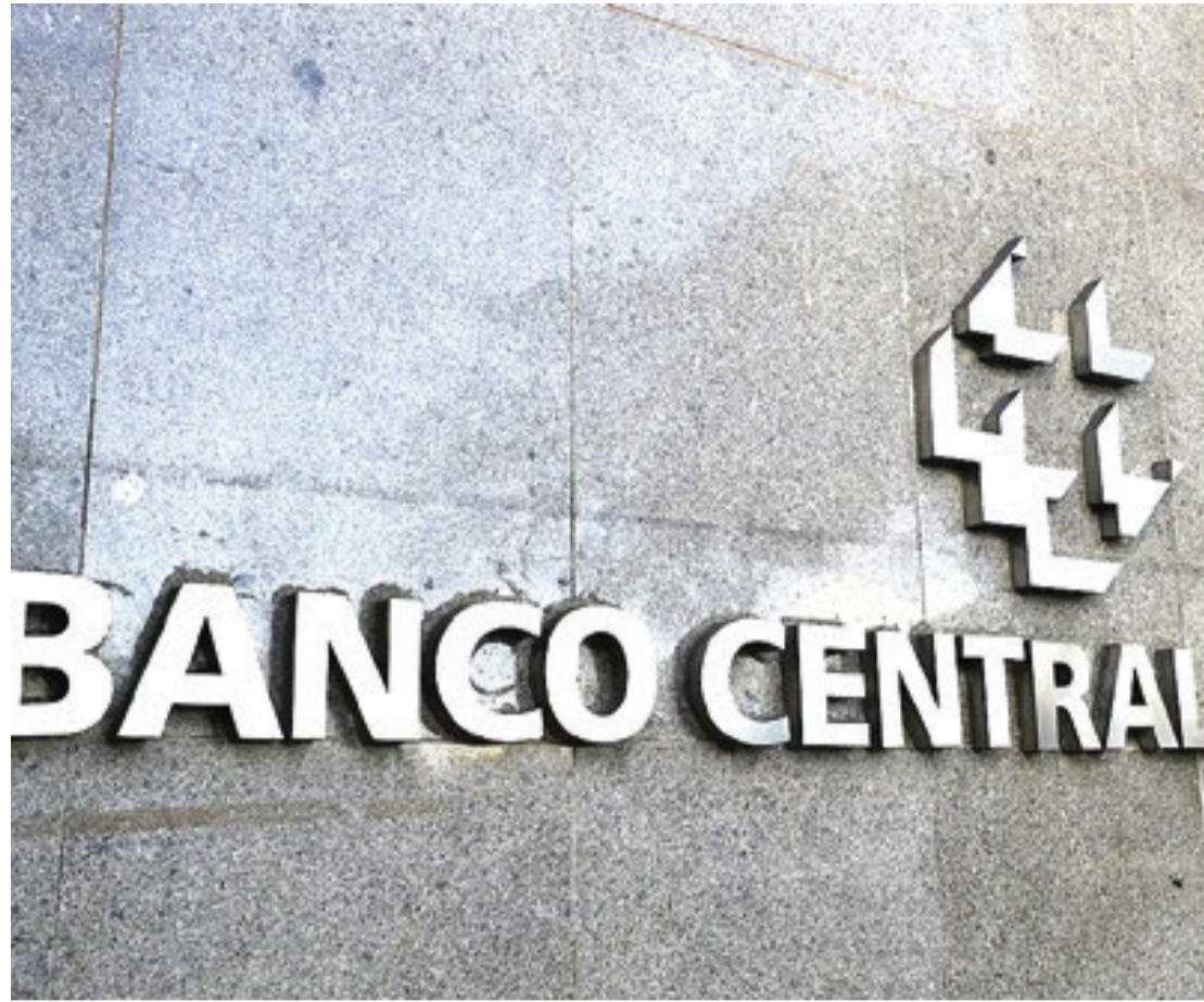
Atualmente, Banco Central (BC) tem seu orçamento definido pela Lei Orçamentária Anual (LOA)

A proposta também tem apoio de entidades do setor