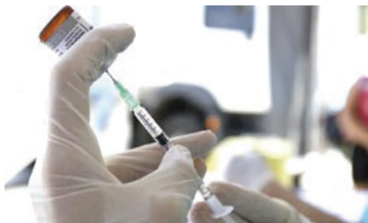
Com aumento da doença nos países-sede da Copa, especialistas reforçam a importância da vacinação antes das viagens

Os números chamam a atenção. O Canadá registrou